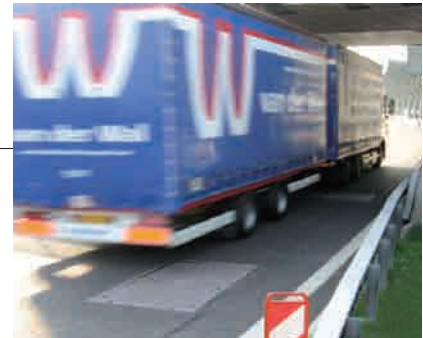
ROLLMATIC Fig. 2535 „autoroute“ Autoroute A2 Chiasso-Brogeda voies de circulation pour poids lourds

Par son utilisation, le socle béton préfabriqué, modèle 62 devient partie intégrante avec la chambre par un lien monolithique.