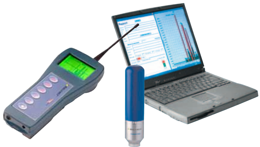
Wasserverlust - Tabelle

Kleine, verborgene Lecks verursachen erstaunlich grosse Wasserverluste: Bei 3 bar Wasserdruck verursacht ein Leck von 8 mm Durchmesser einen jährlichen Verlust von 24'870 m 3 , bei 10 bar einen Verlust von 52'580 m 3 .